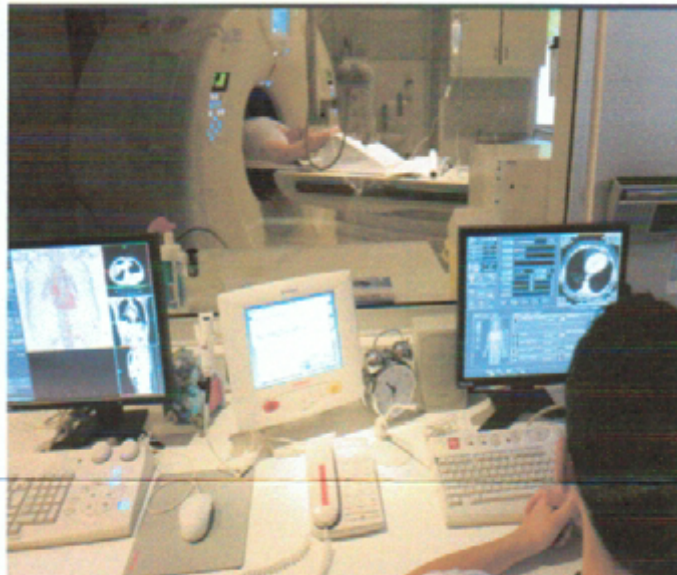
DOC. 2. Consultation médicale au C.H.U de Nancy en 2008