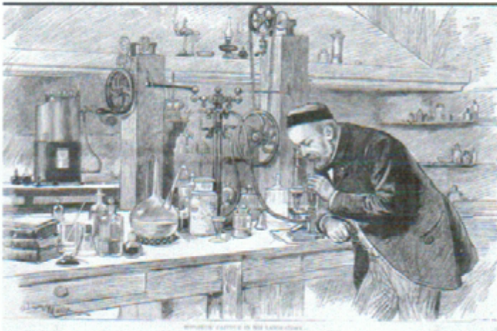
DOC. 1. Louis Pasteur dans son laboratoire de l'Ecole normale supérieure, gravure de A. Marie, publiée dans l'Univers illustré, 1885