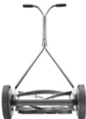
▲ Tondeuse à main

5.c) Dire comment ces trois inventions ont transformé profondément les objets techniques. OUTIL → matière MACHINE → énergie ROBOT → traitement de l'information