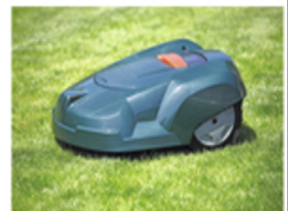
▲ Robot tondeuse