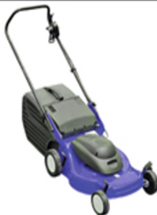
▲ Tondeuse à moteur